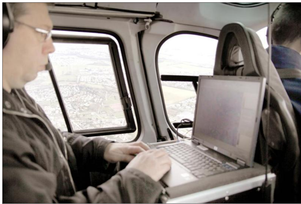
■ Le traqueur de fuites et de déperdition de chaleur a œuvré une journée et demi.