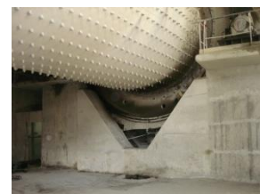
Etude du massif