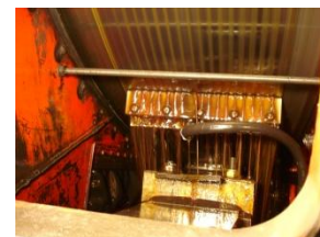
Mouvement d'un broyeur