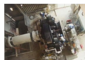
Diagnostic d'un réducteur