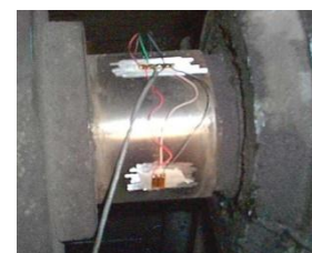
Mesure du couple